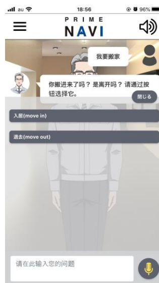
多言語対応画面 ※イメージ