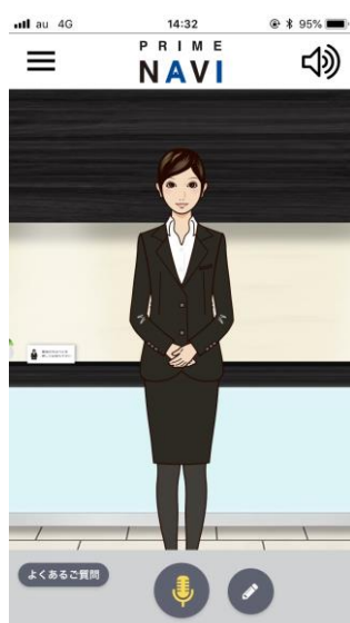
アプリTOP画面 ※イメージ