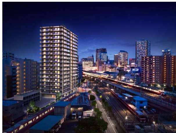
「プライムスタイル川崎」完成イメージ図

参考URL： https://www.keikyu.co.jp/company/news/2019/20191126HP_19182EW.html